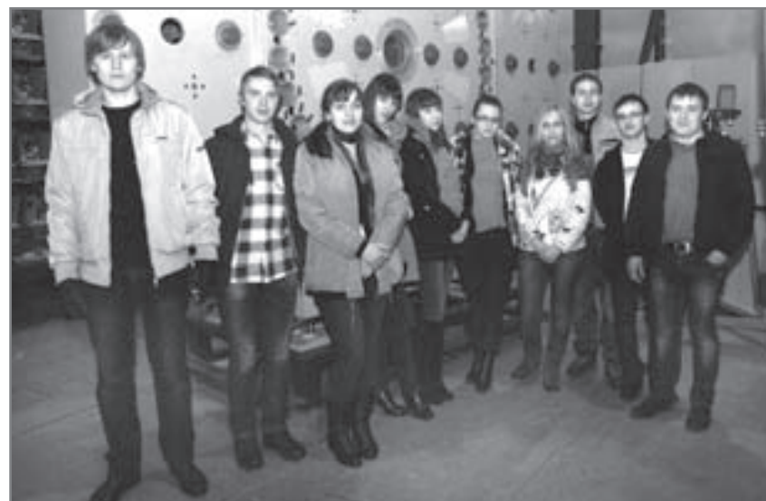
Студенты Ковровской государственной технологической академии им. В.А. Дегтярева в музее г. Радужного и на стенде «Тандем» ФКП «ГЛП «Радуга»